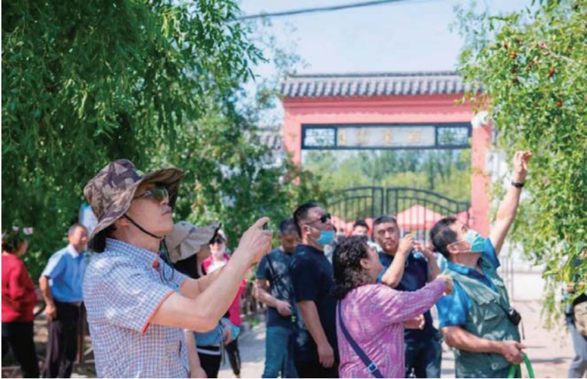
自驾推广活动走进乐陵。

面临新形势、新需求，围绕疫情防控常态化，如何创新宣传推介方式，加强“好客山东”品牌推广，深入挖掘山东文旅资源，讲好山东文旅故事，是今年文旅宣传推广工作者面临的重要课题。山东省文化和旅游厅在产品研发、推广营销方面科学应变、主动求变，努力丰富出游产品供给，有效提振文旅消费。