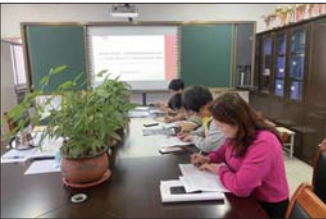
主题党日活动 近日，沂源县鲁山路小学党支部全体党员开展了9月主题党日活动。（王晗）

为进一步启发幼儿的爱国意识，近日，淄川区实验幼儿园举行了“歌唱祖国 喜迎国庆”升旗仪式。护旗手握红旗，精神抖擞，迈着坚定的步伐，走向升旗台。在庄严的国歌声中，一张张稚嫩又肃穆的脸庞，仰望五星红旗冉冉升起，内心充满了自豪。（程茜）