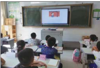
网络安全宣传 近日，沂源县鲁山路小学校开展了网络安全宣传周活动。（王晗）