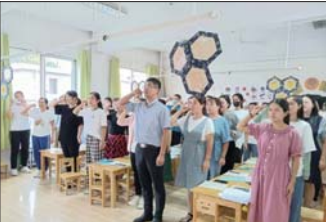
师德师风教育 近日，沂源县振兴路幼儿园组织全体教师开展了“师德铸师魂”活动。（王慧）