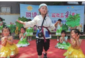
绘本特色活动 近日，沂源县悦庄镇埠村幼儿园举行了绘本特色活动。（宋爱华）