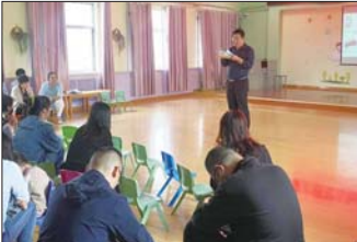
召开教师大会 日前，沂源县鲁山路小学召开新学期教师会。（王晗）