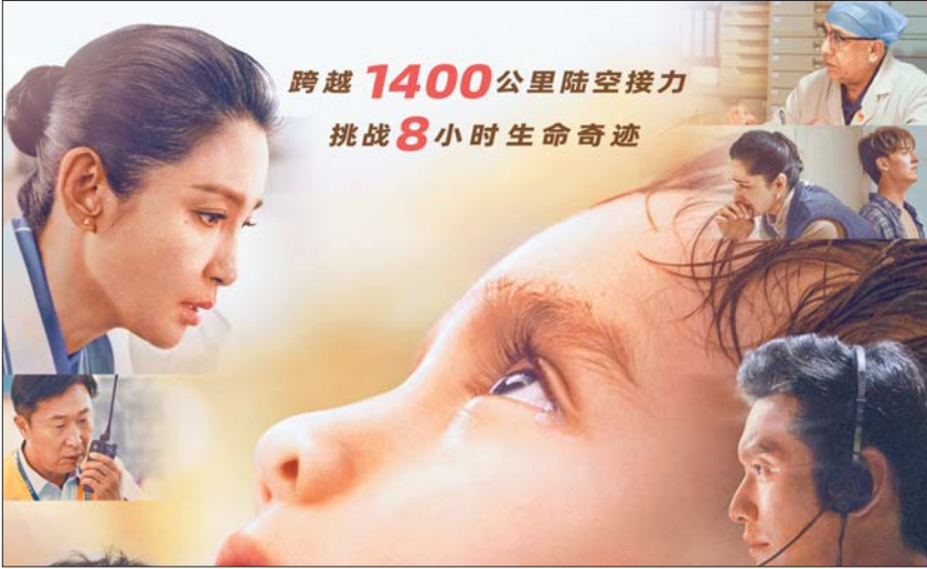
电影《平凡英雄》海报。

雄》《钢铁意志》,相对于以往的新主流大片,在表现形式上有一些类似的元素存在。比如,三部影片都有真实的原型故事,这与经典叙事新表达或者将个人价值与国家命运充分融合的以往创作有类似的地方。比如相对于《湄公河行动》《红海行动》《战狼》系列,《万里归途》大部分时间里有典型的“异域奇观”呈现。比如《平凡英雄》的拯救之路,在结构上也类似于《中国机长》。