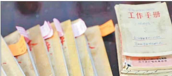
这账一记就是37年，账本越攒越多。

时他的退休金一个月2050元，我的退休金也在2000元左右，俩人一月的收入约4000元。