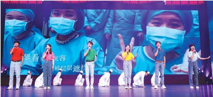
颁奖典礼上的精彩演出。

凡的时代,奉献了众多充满诚意、有生活气息的高质量微电影作品。比如《父亲的饭盒》,就以一个饭盒为故事线索,展现了抗疫医护人员舍己为公的奉献精神,细节设计动人,人物形象丰满,获得了评委会的一致好评。该片获得“社会单元故事片金奖”,同时获得了“优秀编剧奖”和“优秀表演奖”。山东省电影家协会主席于海