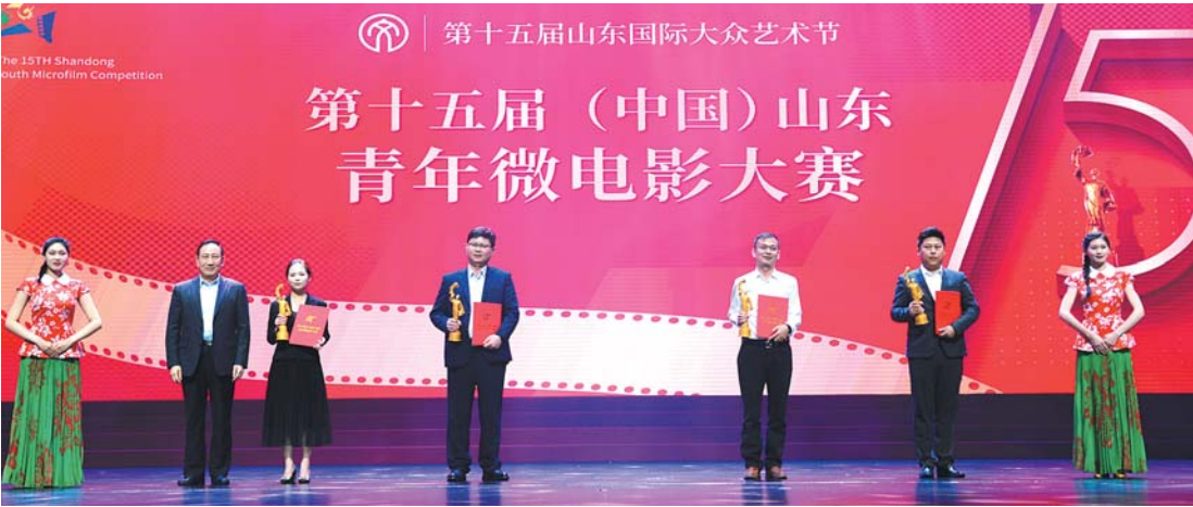
典礼上为大赛金奖获得者颁奖。

“你好,青年!”一句动情的问候,成为本场颁奖典礼的开场白。29日下午,山东省会大剧院的舞台之上,一批充满朝气的青年电影人,成为聚光灯下的主角。通过第十五届(中国)山东青年微电影大赛这一平台,一大批优秀青年电影人及作品脱颖而出。他们有的已经是专业影视从业者,有的还是在校大学生。虽然艺术修为和作品风格不尽相同,但都在以自己的方式观察记录当下这个不平