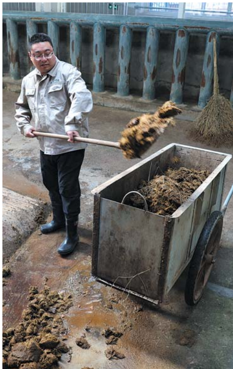
犀牛保育员是个体力活,每天清理粪便要不少时间。