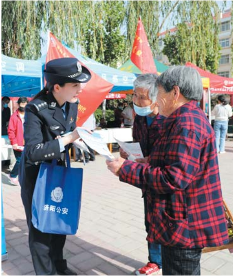
开展防诈骗、防盗等宣传。