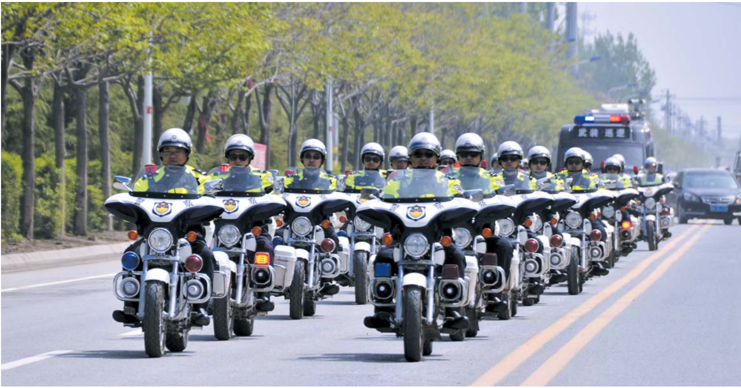
“快反骑警队”开展治安巡逻。

近年来，济阳公安分局在市局党委和区委、区政府的坚强领导下，始终锚定“打造最安全城市、建设最满意过硬队伍”目标，为全区经济社会发展创造了安全稳定的政治治安环境。特别是今年以来，分局紧紧围绕市局“12565”和区委“12345”工作体系，紧扣安保维稳“一条主线”，围绕群众安全感和满意度“两个提升”，推进现代警务工作体系“三项改革”，从五个方面推动公安工作高质量发展，扎实推进“20+3+N”重点工作项目，强力锻造“儒警铁军”，向党和人民交上了一份满意的答卷。分局荣膺“全省精神文明单位”“平安济南建设先进单位”称号，被区委、区政府记集体三等功，荣获“服务经济社会发展一等奖”“社会治理集中攻坚考核‘优秀’档次”等多项荣誉。