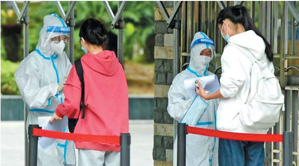
10月29日,福州考生有序进行教师资格考试。(资料片) 中新