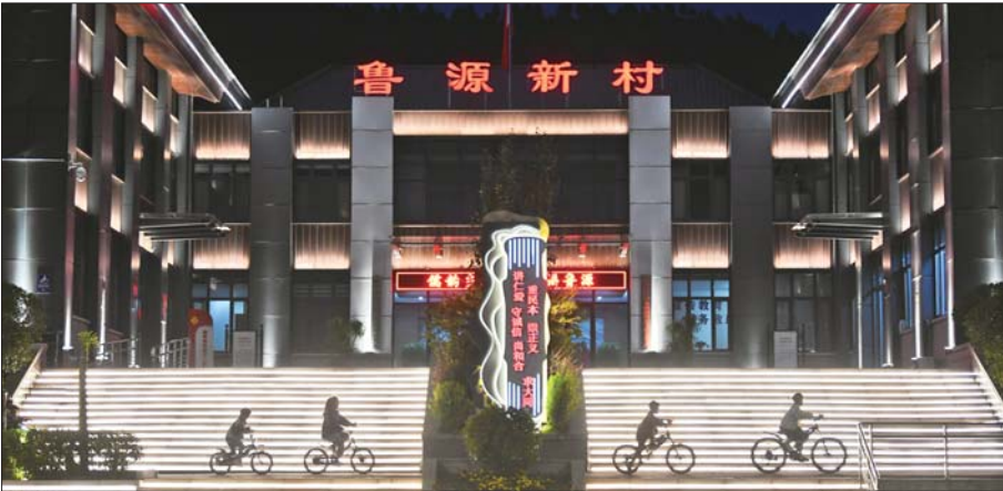
优秀传统文化“两创”示范点——鲁源新村儒韵浓厚。

站在新的历史起点上,曲阜文化建设示范区将以党的二十大精神为指引,奋力打造新时代优秀传统文化“两创”新标杆,不断开创优秀传统文化传承发展新局面,在筑牢文化自信根基、推动中华文化走出去、服务国家文化战略过程中实现更大作为。