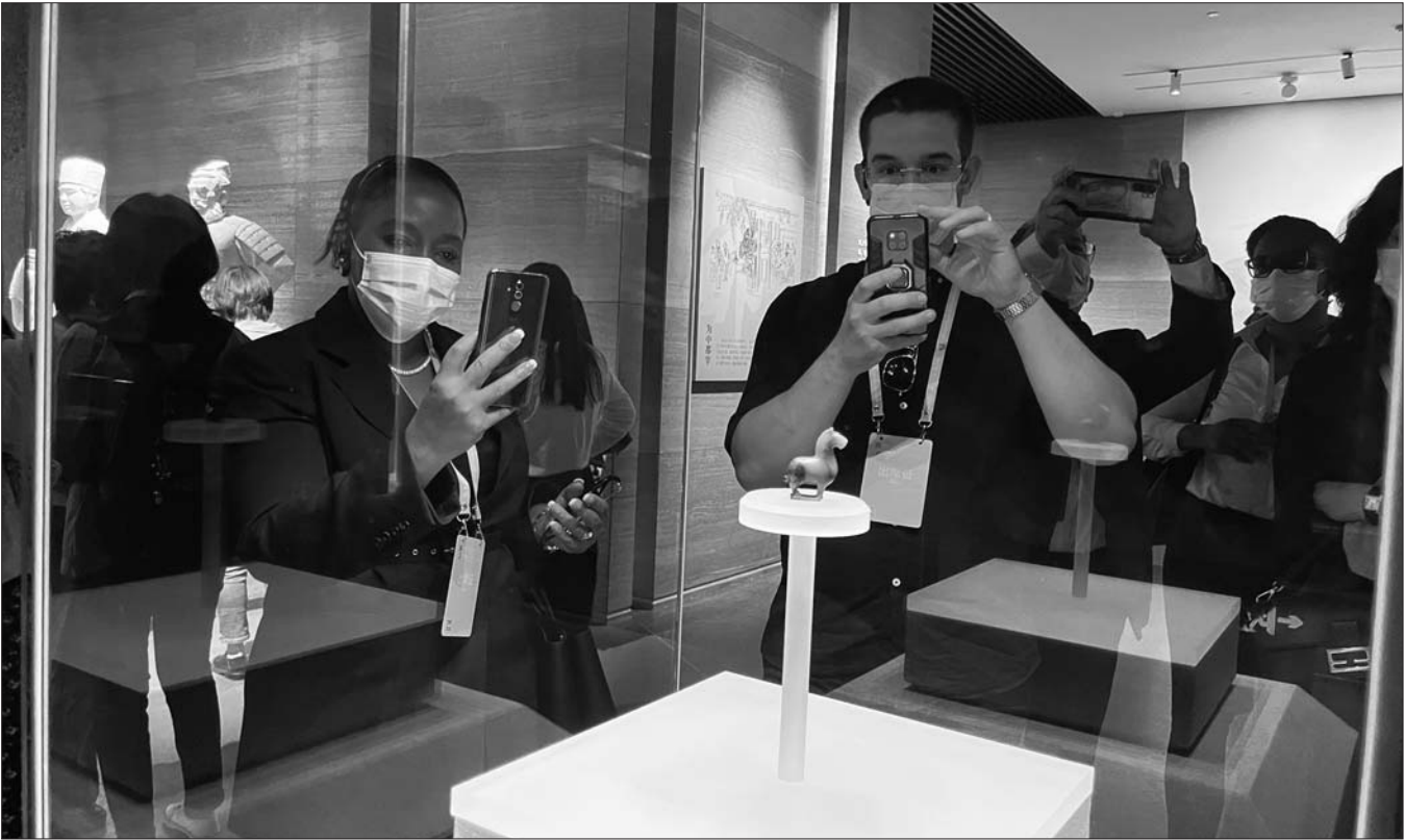
精美展品引得游客拍照记录。

作为“三孔”文化的延伸,孔子博物馆的藏品主要来源于孔府旧藏,70余万件各类馆藏文物中,闻名于世的藏品包括明代以来的30万件孔府私家文书档案、宋代以来4万多册古籍图书、8000多件明清衣冠服饰以及大量的与祭祀孔子有关的礼乐器等。 开馆以来,孔子博物馆通过开展文物本体保护、预防性保护、数字化保护,构筑科学稳固的文物保护工作体系,不断增强文物保护能力。依托国家级古籍修复技艺