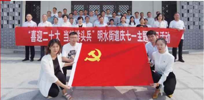
庆“七一”主题党日活动。