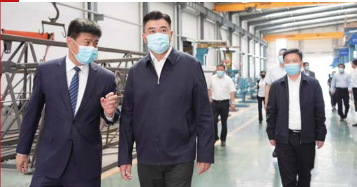
区委书记马志勇调研重点企业。

2022年,在章丘区委、区政府的坚强领导下,明水街道全面对标全区“5+4”工作布局,扎实开展“5+5”重点工程,大力实施产业发展、乡村振兴、生态保护、社会治理、民生福祉“五大攻坚”,着力强化党建、作风、法治、德育、安全“五大保障”,统筹推进疫情防控和经济社会有序发展。先后获得“济南市2021年度全国文明典范城市创建工作突出贡献集体”“济南市攻坚克难好团队”“2021年度济南市人居环境整治突出镇街”“章丘区全域出彩示范街道”等多个荣誉称号。在今年济南市105个镇街人居环境整治考核及章丘区历次人居环境检查考核中,始终名列前茅。