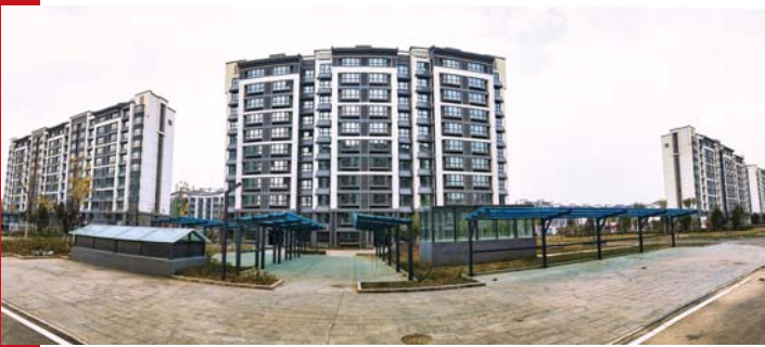
住进玉泉花园回迁房,市民喜迁新居。

人帮扶、专门服务、专题协调”为项目建设提供“店小二”式服务,全力打造与企业亲清关系,为企业持续稳定发展注入活力。