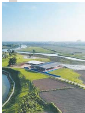
屈家岭遗址区航拍图