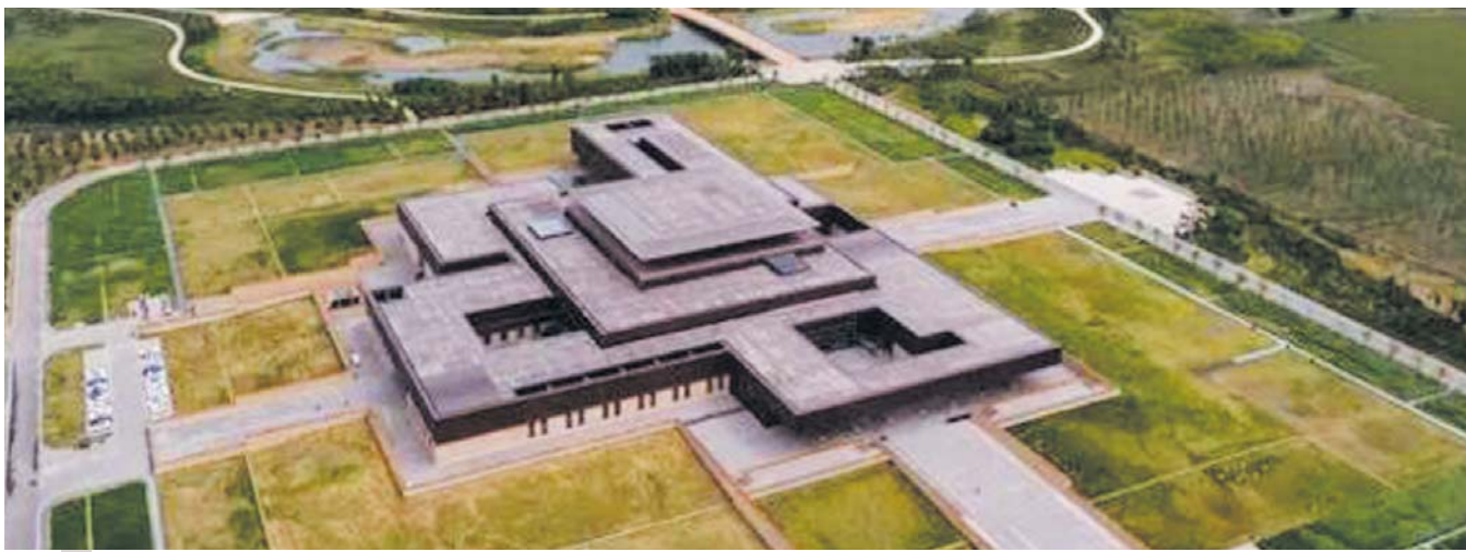
二里头国家考古遗址公园