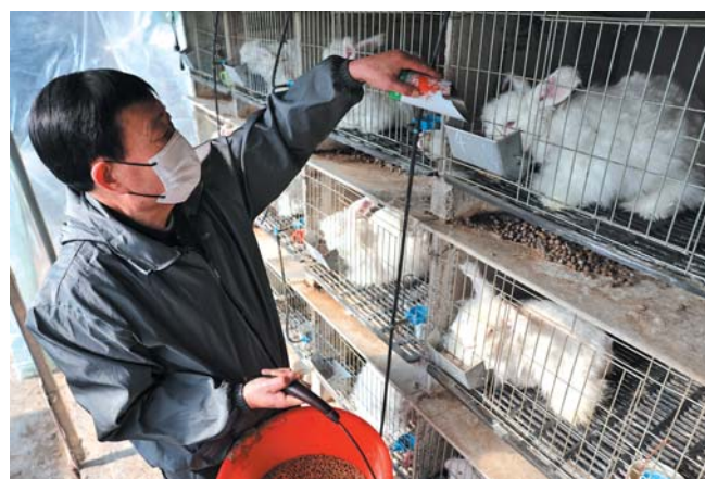
养兔40年,公为迎常说想把兔养好,就要像养孩子一样对待兔子。