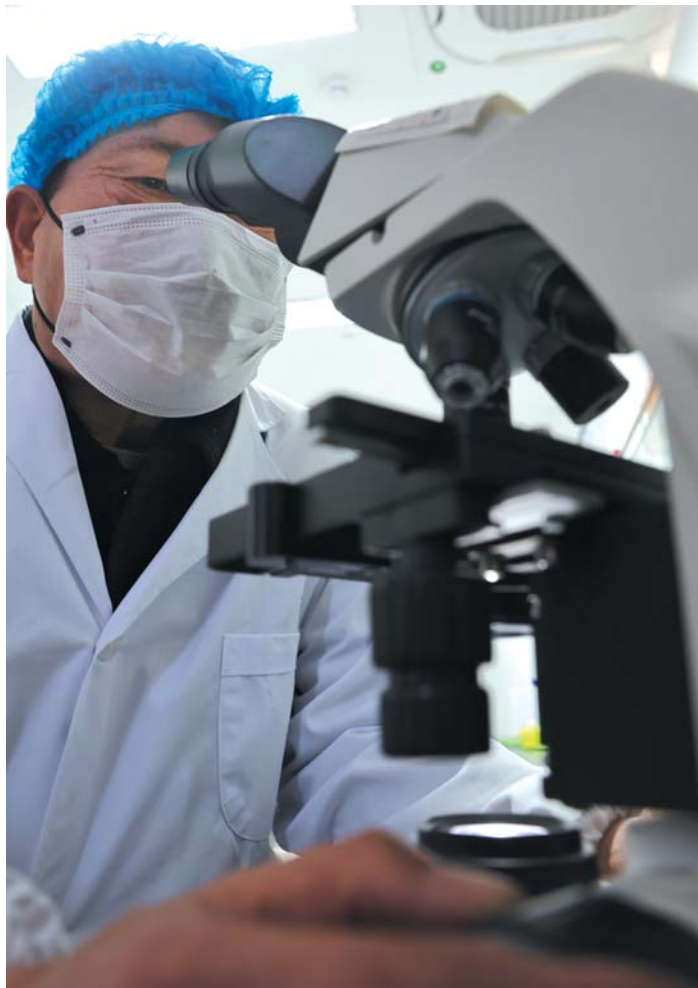
公为迎特别注重优质兔的选种与培育,在养兔上下了不少功夫。

2012年后,在长毛兔市场普遍追求高产、兔毛粗直壮的大背景下,他另辟蹊径,花七八年时间,选育出绒毛性长毛兔。所产兔绒毛细密纤长,被称为“纤维中的软黄金”,先后推广到河北、山西、辽宁等地。近年来,兔毛行情低迷,他积极探索,又选育出“观赏产绒多用兔”,带动蒙阴当地养殖户共同致富。