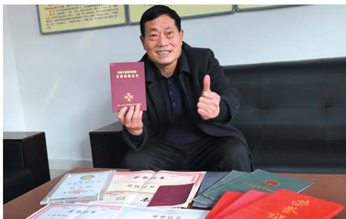
公为迎靠着养兔获得了不少荣誉。