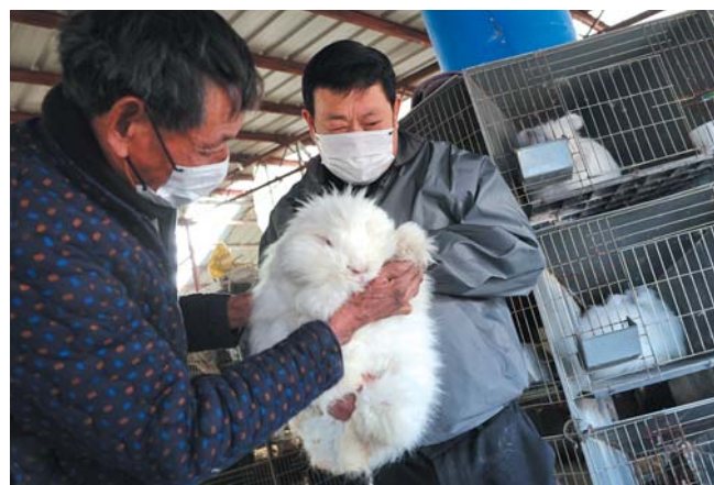
公为迎把最新的养殖技术传授给其他养殖户,共同致富。