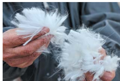
公为迎养的长毛兔不仅产毛量高,而且毛又细又长、弯曲度好。