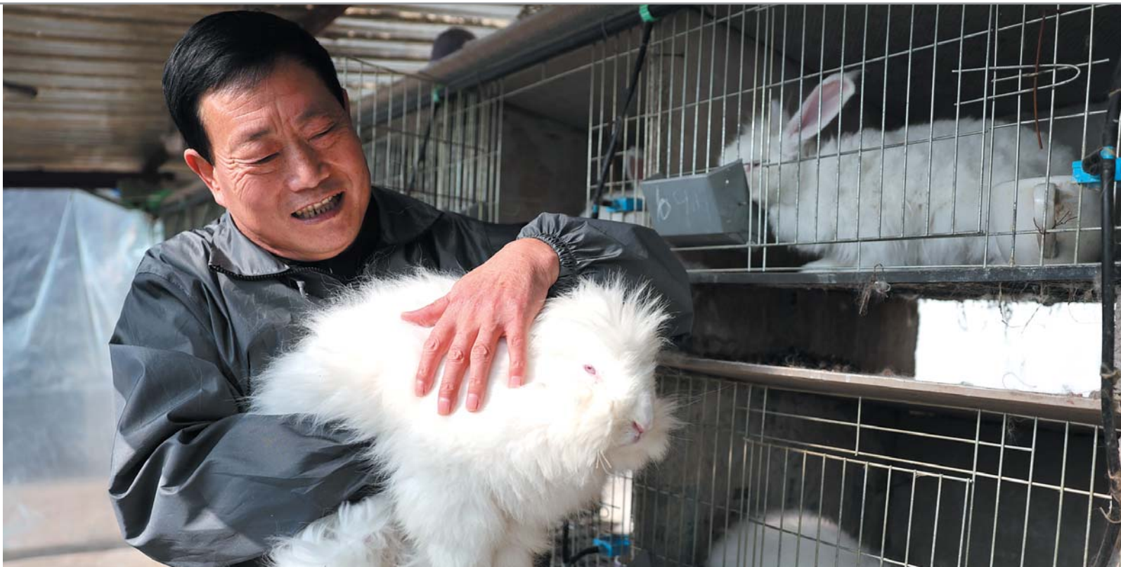
能产毛能观赏,这些优质长毛兔被公为迎视为宝贝。