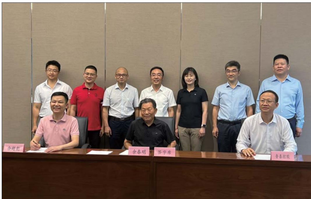
鲁泰控股集团收购黄山胶囊控股权签约仪式。