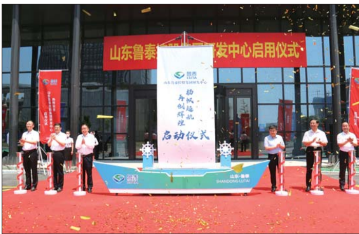
鲁泰控股集团科技研发中心正式启用。