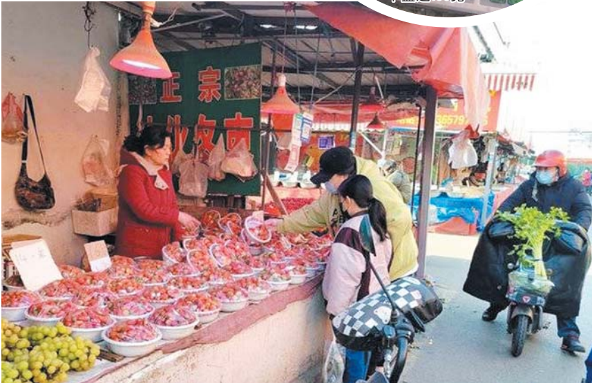
记者探访多家水果店和果蔬批发市场发现，按盆卖草莓几乎成为常态。

源，他表示：“人家(生产商)知道我们这边种草莓，有专门的人往这边送，给我们都是批发价，三毛五一个，我们一个草莓季最少也得用1万个。”记者粗略计算，按照目前草莓的市场平均价15元一斤，消费者需要花费三元买一个盆，而其批发价只有三毛五，这样算下来，一个盆的“利润”就有2.65元，1万个盆就是2.65万元。