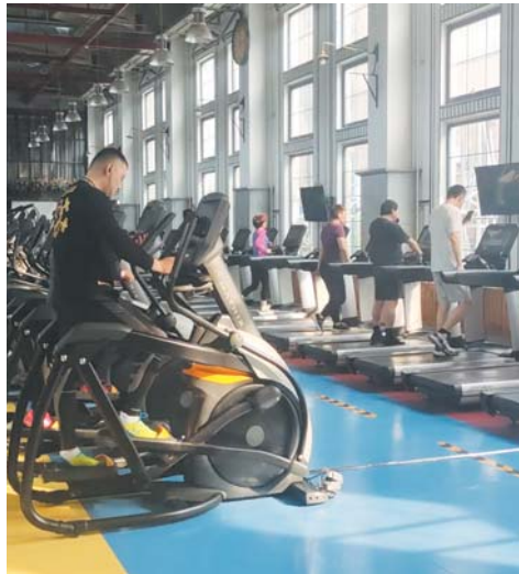
2月8日，中健健身建设路店有上百位会员到店健身。

“感谢众多会员和员工给予我们的帮助和理解，现在济南11家门店已恢复营业，希望会员和员工能继续支持我们，中健健身会好好‘活’下去。”该负责人说。