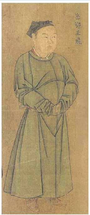
南宋刘松年《中兴四将图》中的岳飞形象。

电影《满江红》的热映让岳飞和他所处的两宋相交那个时代的历史再度受到人们关注。长期以来，大家对于岳飞的认知往往存在两种偏差，一种是在被经过秦桧篡改的史料影响下，认为岳飞是军阀，不懂政治等；一种是受到岳飞之孙岳珂的《鄂国金佗侔编》影响，将岳飞塑造为一个愚忠的形象。那么，历史上的岳飞究竟是怎样的？著名历史学家王曾瑜在《尽忠报国——新岳飞传》一书中进行了纠偏，还原了岳飞作为民族英雄和军事天才的真实形象。经出版社授权，本报摘录相关章节，以助看过电影《满江红》的读者了解岳飞之死的前前后后。本文标题和小标题均为编者所加。