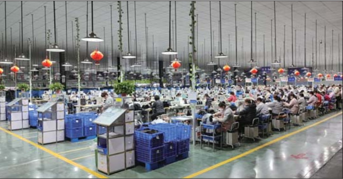
斯凯奇中国北方研发生产基地项目。