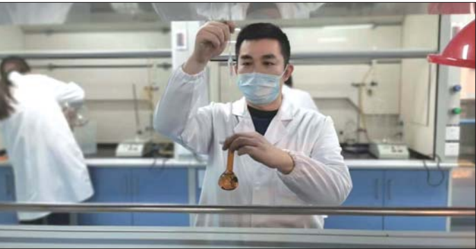
研究人员在辰欣佛都药业液相室内开展科研工作。