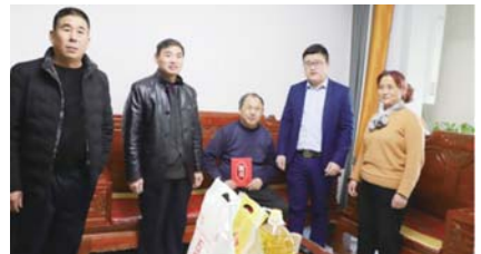
全国助残日，为精神残疾家庭送去慰问品。