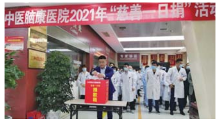
每年都举行“慈善一日捐”爱心捐款活动。