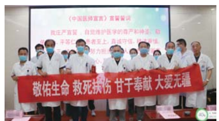
庄严宣誓，郑重签名，践行初心。

杜绝生、冷、硬、顶、推等不良现象，使医务人员想病人之所想，急病人之所急，就医环境更加温馨，为社会展示了医务人员“廉洁行医，诚信服务”的良好行业风尚和崇高职业形象，拉近了医患双方的距离。