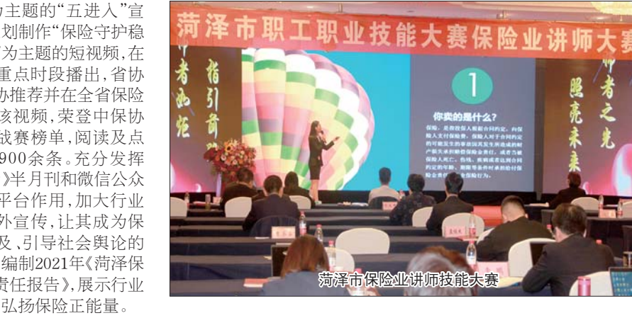
菏泽市保险业讲师技能大赛

为更好地服务保险消费者,菏泽保险业成立“e+智慧法庭”,保险业仲裁中心,促进保险纠纷源头化解、多元化解、实质化解,进一步营造良好的金融生态环境。菏泽保险业与菏泽经济开发区区人民法院在已有的线下诉讼与调解相衔接机制基础上,设立“e+智慧法庭”,建立起人民法院裁判工作与保险业纠纷调解工作在线对接机制,进一步突破了调解工作的空间限制,节省流转时间,提高工作效率,便利的一站式“掌上”解纷服务,减轻了当事人诉累,让群众办理诉讼事更加便利快捷。 菏泽保险业大力推进“合规经营、优质服务”活动,以合