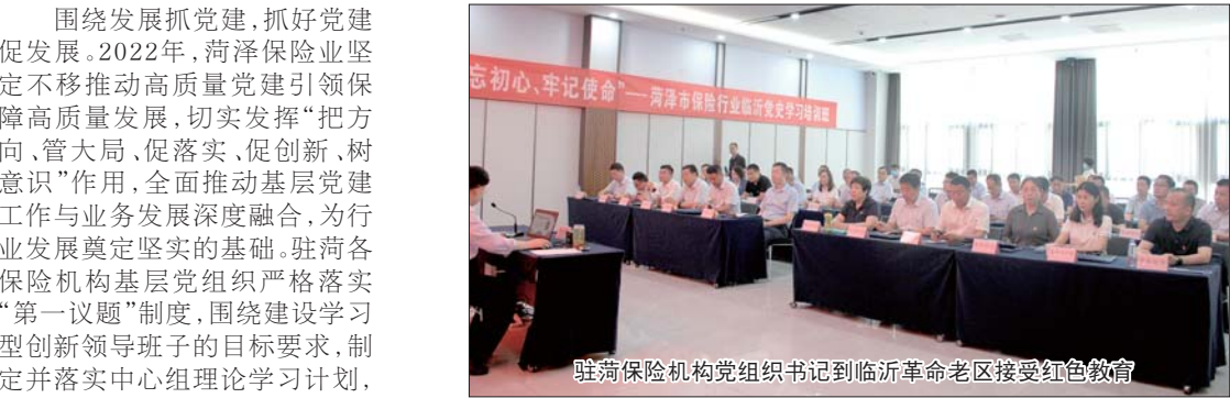
驻荷保险机构党组织书记到临沂革命老区接受红色教育

围绕发展抓党建,抓好党建促发展。2022年,菏泽保险业坚定不移推动高质量党建引领保障高质量发展,切实发挥“把方向、管大局、促落实、促创新、树意识”作用,全面推动基层党建工作与业务发展深度融合,为行业发展奠定坚实的基础。驻荷各保险机构基层党组织严格落实“第一议题”制度,围绕建设学习型创新领导班子的目标要求,制定并落实中心组理论学习计划,通过“三会一课”、组织生活会和“主题党日”等制度,持续巩固推进“两学一做”学习教育,“不忘初心、牢记使命”主题教育,党史学习教育常态化、长效化。先后开展了“缅怀革命先烈”、“争做新时代合格党员”等主题党日活动,“传承社会主义核心价值观、厚植诚信理念、建设保险文化”系列专题讲座,“学党史、悟思想、办实事、守初心”系列主题教育活动。驻荷保险机构党组织书记和党员干部分别赴临沂等红色教育基地以理论与实践相结合形式开展学习。在临沂红色教育基地,大家聆听《党史智慧与红色管理》讲座、参观孟良崮战役纪念馆、向革命先烈敬献花篮、重温入党誓词,深刻感受党的百年奋斗史,深切体会党的优良传统和革命精神,坚定了理想信念,强化了新时代使命担当意识。推动全面学习贯彻党的二十大精神,举办“奋进新征程”征文比赛和图片展,通过集中收看开幕式、撰写学习心得、中心组学习、晨会专题学习、讲座宣导、知识测试、“亮成果、促提升”等多种形式,使党员干部学习全覆盖,在学深悟透中坚定“两个确立”,增强“四个自信”,做到“两个维护”。 高质量党建统一思想、凝聚共识,引导和激励全体保险人员用实际行动践行“守初心、担使命、敢担当”的责任使命,引领了业务工作高质量发展。