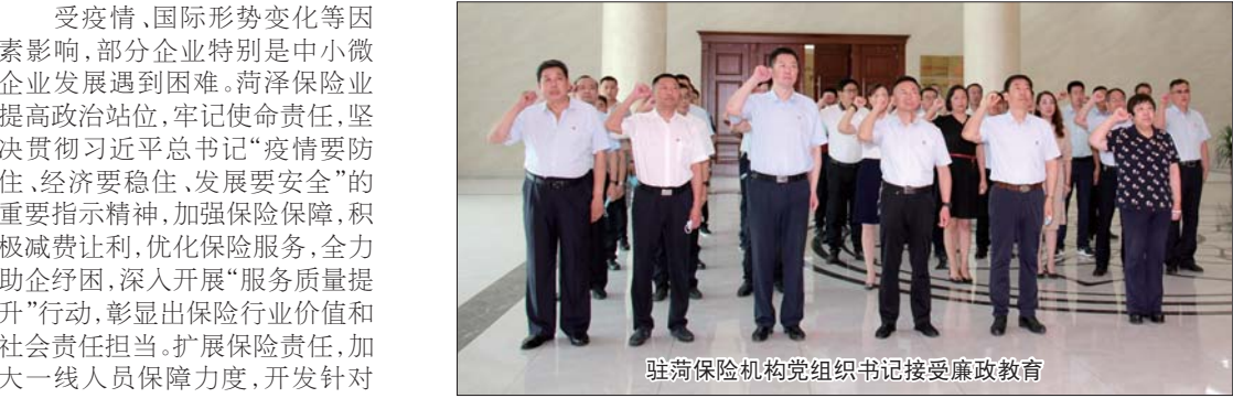
驻荷保险机构党组织书记接受廉政教育

受疫情、国际形势变化等因素影响,部分企业特别是中小微企业发展遇到困难。菏泽保险业提高政治站位,牢记使命责任,坚决贯彻习近平总书记“疫情要防住、经济要稳住、发展要安全”的重要指示精神,加强保险保障,积极减费让利,优化保险服务,全力助企纾困,深入开展“服务质量提升”行动,彰显出保险行业价值和社会责任担当。扩展展责任,加大一线人员保障力度,开发针对疫情的低费率、高保障的法定传染病保险,减轻复工企业的经济负担;对于已参保安全生产责任保险的企业,免费扩展企业保险责任,扩大保障范围;因防疫工作需要停产停工的,免费为企业适当延长保险期限;缓解企业压力,适当缓缴保费,允许企业分期付费;为进企业提供短期出口信用保险风险保障,支持企业复工复产;持续推进保险创新,推动安全生产责任保险,积极探索环境责任保险、食品安全责任保险等新业务,提高服务企业风险保障能力。