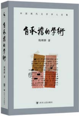
《有承担的学术》 钱理群 著 活字文化 | 四川人民出版社

本榜单从当月最新出版的文学艺术、历史传记、思想社科图书中，参考图书网店的数据及专业书评媒体的评价，以人文性、思想性、趣味性为标准，筛选出一本重点推荐图书和九本好书，期待其中的某一册能够进入您的内心。