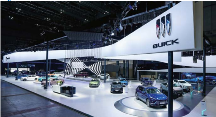
别克展台云集MPV、SUV、轿车家族和新能源四大产品系列。

4月18日，备受瞩目的汽车行业年度盛会——第二十届上海国际汽车工业展览会于今日在国家会展中心(上海)拉开帷幕。上汽通用汽车以“向新而行，共赴美好”为主题，携旗下别克、雪佛兰和凯迪拉克三大品牌共34款展车盛装亮相。位于3号馆的上汽通用汽车强大的参展阵容，连同融合前沿科技、品牌文化的精彩互动和创意布展，不仅呈现了三大品牌积极推进电动化、智能网联化发展的最新成果，也清晰映现出上汽通用汽车焕新出发、加速转型，“以创新的汽车产品和服务，引领智慧出行，成就美好生活”的不懈努力。