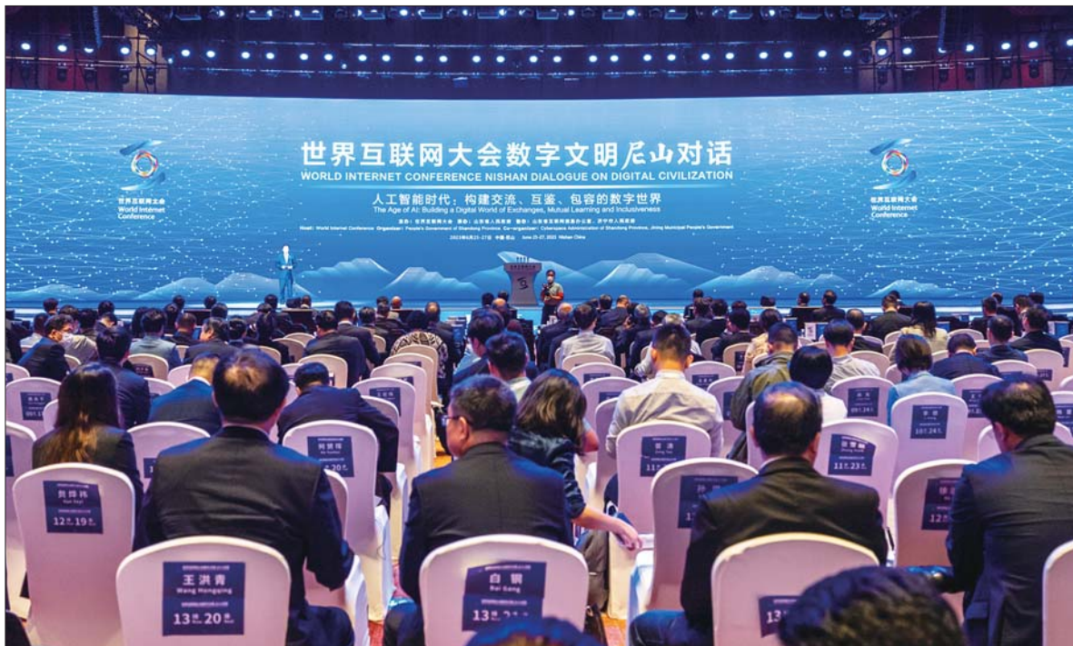
世界互联网大会数字文明尼山对话现场。

历届世界互联网大会乌镇峰会上，全球互联网巨头们交流思想、探索规律、凝聚共识。在我国倡导以及世界各方共同努力