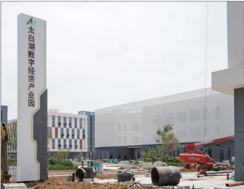
太白湖数字经济产业园建设已进入收尾阶段。

作为太白湖新区“一中心、四园区、N基地”的园区发展格局重要一环,太白湖数字经济产业园建设已进入收尾阶段,预计今年7月底投用。届时,太白湖数字经济产业园将成为太白湖新区乃至全市的重要产学研用基地,有力促进新区经济结构转型升级,完善本地经济业态。