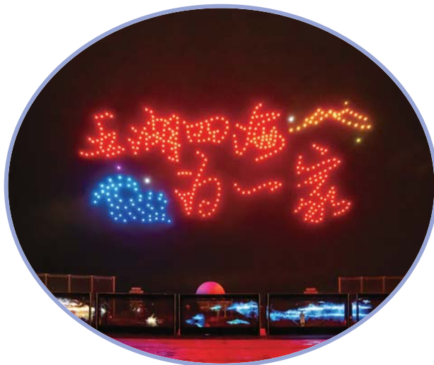
光影秀向四海宾朋发出了尼山的邀请。

尼山是孔子出生地,是儒家文化发源地,“天涯若比邻”光影主题秀,既是对优秀传统文化的继承发扬,也是对互联网时代的创新思考。更具魅力的尼山,更靓眼的优秀传统文化,让“大同世界”连接你我。