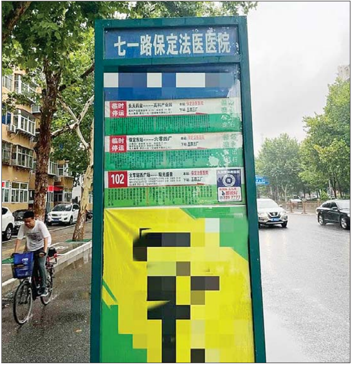
七一路保定法医医院站点有多趟公交线路停运。

因部分公交线路长期停运迟迟未恢复,河北省保定市引起社会关注。 连日来,齐鲁晚报·齐鲁壹点记者实地探访发现,保定中心城区几乎每个站点都有线路停运,且等车时间较长。晚高峰期间,记者等了1小时20分钟才等来想坐的公交车。