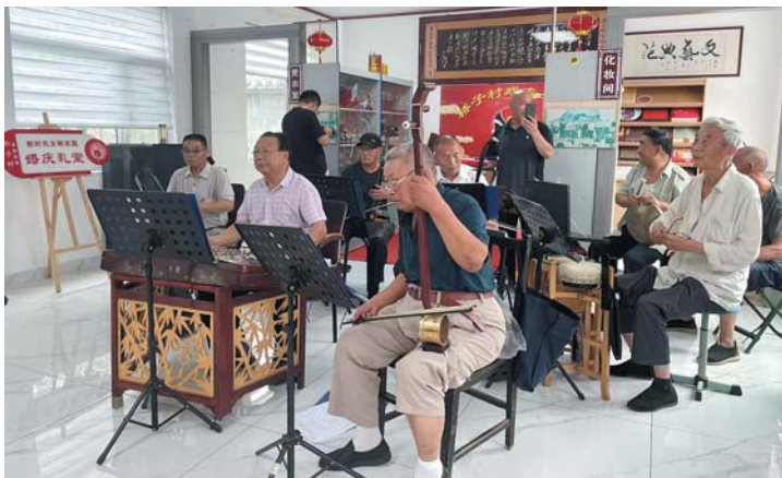
来自村里“戏友之家”庄户剧团的文艺志愿者正在演出。

心片区，是省级田园综合体、省级城乡融合试点项目、济南市重点建设项目，通过坚持“点、面、线”三维发力，加快一二三产业深度融合，助推农文旅融合，跑出乡村振兴加速度。