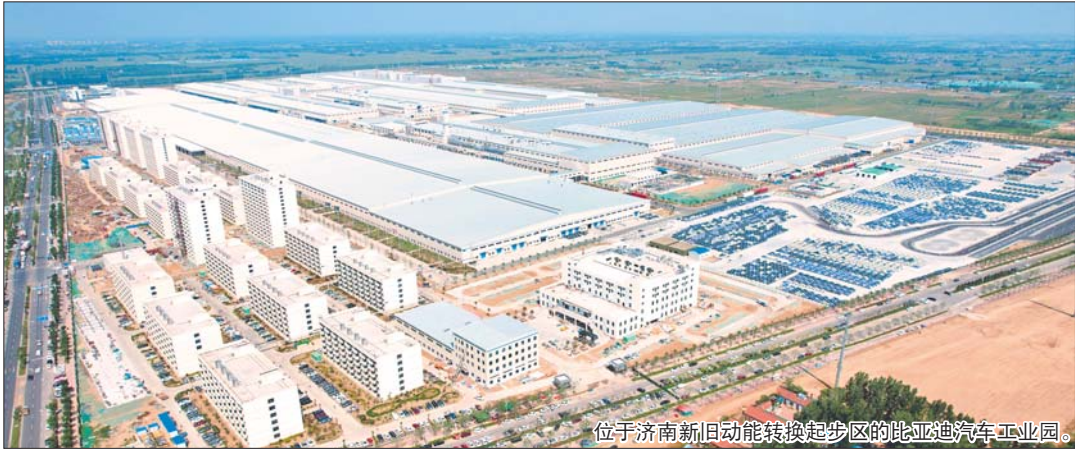
位于济南新旧动能转换起步区的比亚迪汽车工业园。