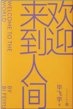
《欢迎来到人间》 毕飞宇 著 人民文学出版社

晚明大将熊廷弼“有胆如兵”，以严明著称，但万历、天启年间因性格刚烈，“好谏骂，不为入下”，招致颇多非议。他一生三入辽东，终为党争所陷，其跌宕起伏的官场人生，正是晚明政局的缩影。本书围绕熊廷弼之死，记录了熊廷弼最后17年的人生，以及晚明的边防形势和政治争斗。通过对历史细节的剖析，书中一改熊廷弼过去相对单一化的传统形象，以公允持正的目光审视历史，深挖熊廷弼复杂、摇摆的政治生涯。作者以熊廷弼作为晚明史的小切口，刻画诸多细节，描摹出晚明众多历史人物丰满的形象，还原了大明危如累卵却无以自救的迟暮困局。