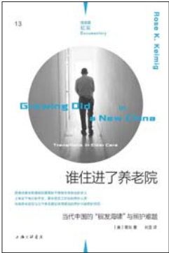
《谁住进了养老院：当代中国的“银发海啸”与照护难题》 [美]葛玫 著 刘昱 译 理想国 | 上海三联书店

这是一部讲述明代妇女生活的专著，内容包括明代人的女性观、明代社会各阶层妇女、礼俗与妇女生活，明代妇女的教育、明代妇女的服饰、明代妇女的社会活动、明代妇女的才艺及其成就，明代女性的“活力”及“多样性”。作者通过对明代妇女生活多方面的考察，阐明了明代妇女在传统礼教闭环世界中形成的妇女群体人格；另一方面，明代中期以后，人们思想活跃，兴趣广泛，视野开阔，受这种社会思想风气的影响，晚明妇女生活也更具有活力与多样性，“明代妇女从‘相夫教子’的温婉闺范，转而变为独立支撑家庭生计的‘健妇’，无疑使女性形象得以重塑，‘女郎’‘女山人’的大量出现，更是足以证明明代女性已经冲破礼教与家庭的束缚与闭锁，转而融入纷繁复杂的社会之中”。