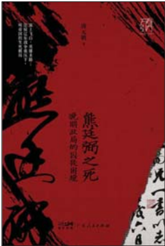
《熊廷弼之死：晚明政局的囚徒困境》 唐元鹏 著 万有引力 | 广东人民出版社

诺贝尔化学奖得主保罗·克鲁岑提出，在地质学上，地球已经进入了被称为“人类世”的新纪元，即人类活动的痕迹完全覆盖整个地球表面的年代。物种灭绝、生态污染、二氧化碳超标……现代化带来的经济增长曾许诺我们富裕生活，实际上却不断透支当下乃至未来的生存资源。日本新锐经济学家斋藤幸平在代表作《人类世的“资本论”》中指出，我们目前面临的种种生态问题，正是资本主义造成的恶果。在生态危机愈发严重的当下，斋藤幸平从马克思的晚年思想中发掘出了其“去增长共产主义”思想，发现了马克思作为生态学家的一面。他认为，马克思的生态学思想，为社会平等和可持续性的实现提供了更多的可能性，恰好能为受困于环境危机的我们指出一条出路。