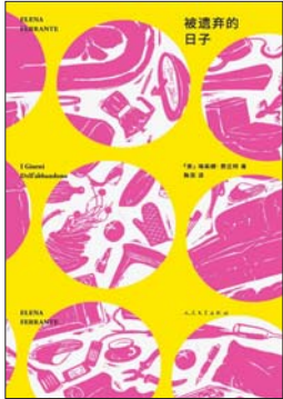
《被遗弃的日子》 [意]埃莱娜·费兰特 著 陈英 译 99读书人 | 人民文学出版社

2014年发现自己罹患口咽癌后，坂本龙一表示“我开始不得不坦然面对和思考自己的生命终点——死亡”，他开始觉得“此刻回顾过去十多年的活动亦未尝不可”。从去年7月到今年2月，坂本龙一以“我还能看到多少次满月升起”为题，由好友铃木正文担任采访者，在日本杂志上连载了8篇文章，几乎是持续到了坂本龙一生命的最后一刻。这些文章被收入他这本最后的自传。坂本龙一分享了自己的音乐创作、参演电影及社会活动的经历，其中包括2011年福岛地震后的回忆。此外书中也记录了坂本龙一的冰岛之旅，以及一边和癌症作斗争，一边继续工作的全过程。