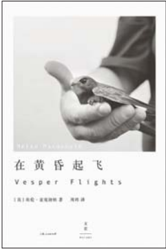
《在黄昏起飞》 [英]海伦·麦克唐纳 著 周玮 译 世纪文景 | 上海人民出版社