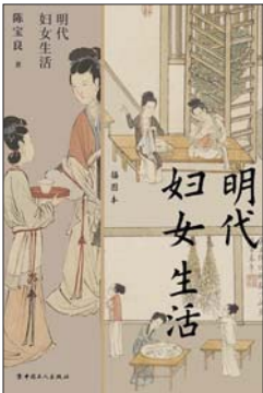
《明代妇女生活》 陈宝良 著 中国工人出版社

埃莱娜·费兰特的真实身份至今是谜。2011年至2014年，费兰特以每年一本的频率出版了四部情节相关的小说《我的天才女友》《新名字的故事》《离开的，留下的》《失踪的孩子》，被称为“那不勒斯四部曲”。小说《被遗弃的日子》是其早年的作品，出版于2002年，讲述了一个女人如何对抗遗弃的故事。38岁的奥尔加突然步入生活的地狱：丈夫马里奥为一个年轻女人抛下她和年幼的女儿。她一封封地给丈夫写无法寄出的信，徒劳理清自己