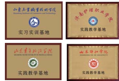
校企合作 产教融合

上养老人才孵化基地,已与山东省阿尔茨海默病防治协会、荷兰综合物理康复治疗协会、济南市护理职业学院、山东青年政治学院、山东商业职业学院、山东协和学院等达成深度合作,搭建医、养、产、教、研融合发展平台,提升养老服务人才技能素质,致力于4050养老护理人员培训与输出,解决