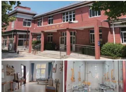
历城区彩石敬老院

敬老院位于彩石街道杏峪村西北,2007年11月建成并投入使用,占地面积7000余平方米,建筑面积3200余平方米。2022年11月敬老院完成硬件设施设备提升改造,设置床位110张,内设双人间、三人间,健康评估室、康复训练室、护士站,餐厅、户外花园等,解决特困老人养老后顾之忧。