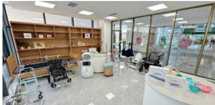
康复辅具租赁中心

历城城发·闵善康养将关爱融入长者日常生活,用心打造专业适老化产品,开展适老化产品售卖、养老辅具租赁业务,线下实地参观、体验、试用,线上咨询、购买、租赁,为长者提供质量优良、价格实惠的适老化产品。