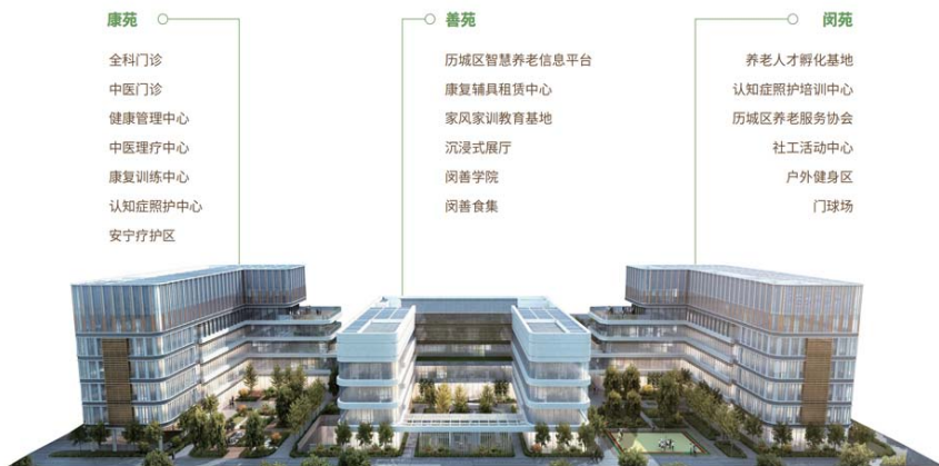
历城区养老服务中心