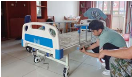
家庭养老床位建设实景拍摄

“家庭养老床位”依托养老机构为老年人提供家庭专业照料、远程监测等居家失能养老服务,把养老机构的护理床位设在家里,把专业服务送上门,让老人“养老不离家”!历城区养老服务中心发挥担当精神,切实履行国企社会责任,承接历城区多个街道的家庭养老床位建设与运营服务。