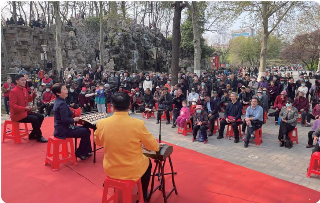
传统曲艺展演在景区备受市民们的追捧。

一些经典曲艺记录下来，“即便今后没人会唱了，但能通过视频看一看、学一学，也是一种传承呀。” 据保护中心办公室工作人员介绍，下一步也将提升这一记录工程的推进速度，把更多济宁地区的传统曲艺，用现代技术保存下来。