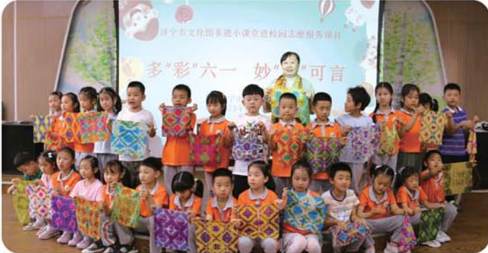
济宁市实验幼儿园的孩子们在课堂上体验非遗项目“扎染”。