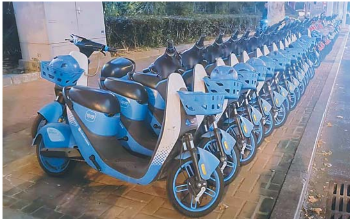
把车放入停车区并不容易。

时，小程序显示“车辆未停放在地面道钉之间”，记者经过多次调整车辆位置才完成还车。这样一来，本来2元的车费，因调整车辆位置耽误时间“涨”为3元。