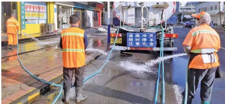
人机结合开展精细化保洁作业。