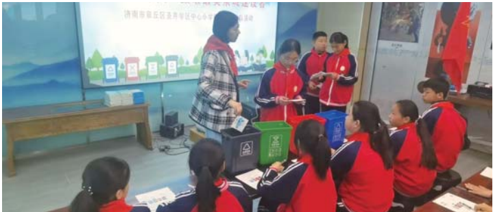
生活垃圾分类宣传进课堂。