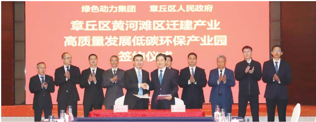
低碳环保产业园落地签约。

2023年，在奋力开创新时代社会主义现代化强区建设新局面总目标指引下，章丘区城管局聚焦打造“有品质、有形象、有温度”的城管工作品牌，以有解思维破题开路、用务实举措管好城市，全区城市环境品质实现大幅提升，市民获得感、幸福感、满意度显著增强。