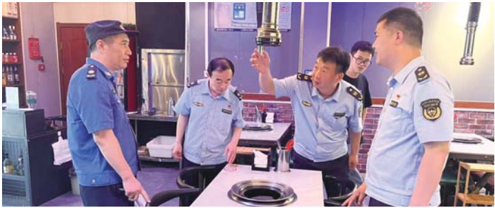
多部门联合执法强化餐厨油烟治理。

聚力攻坚，建筑垃圾治理成效显著。联合有关部门、街道（镇）强力开展全区建筑垃圾专项整治“百日攻坚行动”，依法打击偷排乱倒等建筑垃圾类违法行为，持续健全“区、街道（镇）、村（社区）”