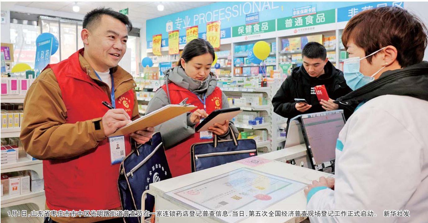
1月1日,山东省枣庄市市中区光明路街道普查员在一家连锁药店登记普查信息。当日,第五次全国经济普查现场登记工作正式启动。