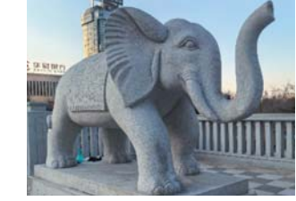
四座潍坊象雕塑矗立在东风桥四周。

建立，“潍坊象”因成为东风桥上四座象雕塑的原型而备受关注。伴随着东风桥上四座象雕塑的诞生，“潍坊象”化石将有望重见于世。