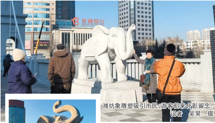
潍坊象雕塑吸引市民、游客前来合影留念。