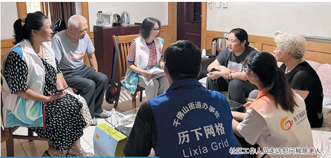
社区工作人员走访慰问独居老人。

2023年，在区委、区政府的坚强领导下，济南市历下区千佛山街道紧密团结和依靠广大干部群众，紧紧围绕“工作创新年”、“招商服务年”，党建引领基层治理工作部署要求，戮力同心、担当务实、争先进位，各项工作更上新台阶。