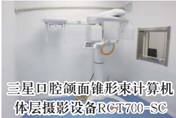
三星口腔颌面锥形束计算机 体层摄影设备RCT700-SC

西门子MAGNETOM Mica 1.5T磁共振,该设备扫描速度快,图像清晰,能对中枢神经系统、椎间盘病变及骨关节软组织等部位进行多序列检查。多功能成像如:MRA、MRCP、MRU、MRSI等,还可以产生很多功能信息,帮助对疾病的诊断。