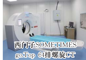
西门子SOMATOM go.Top 64排螺旋CT