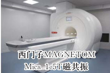
西门子MAGNETOM Mica 1.5T磁共振