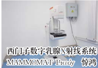
西门子数字乳腺X射线系统 MAMMOMAT Bieady 惊鸿