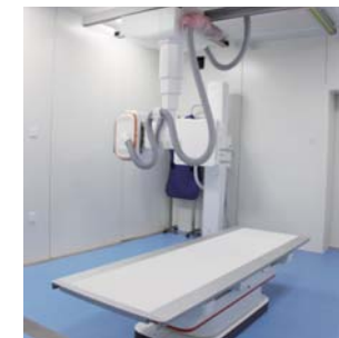
西门子DR数字化 医用X射线射影系统