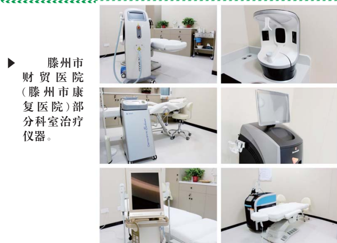
滕州市 财贸医院 (滕州市康 复医院)部 分科室治疗 仪器。