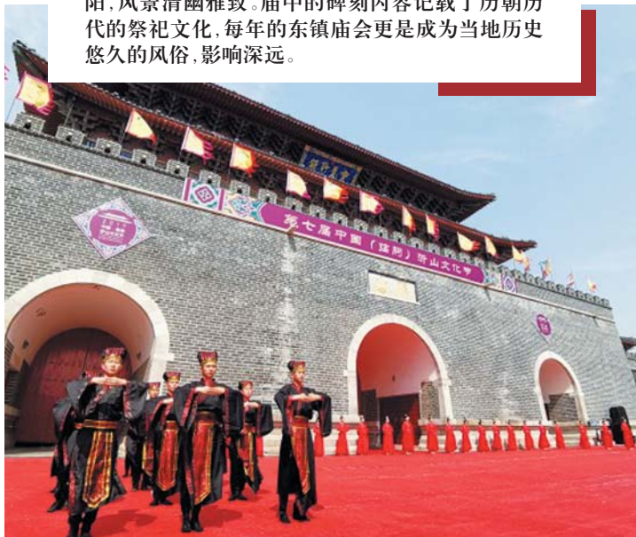
沂山文化节(资料片)。

沂山位于沂蒙山北部，是泰沂山脉的重要组成部分。作为“五镇”之首，沂山是与东岳泰山并称的名山，自古就受到中央王朝的重视。东镇庙是祭祀沂山的主要场所，它背倚凤凰岭，面临汶水，避风向阳，风景清幽雅致。庙中的碑刻内容记载了历朝历代的祭祀文化，每年的东镇庙会更是成为当地历史悠久的风俗，影响深远。