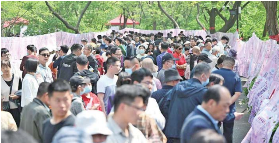
本届三月三千佛山相亲大会,众多单身男女来寻缘。

报告显示,与上届相亲大会类似,本届相亲会报名男嘉宾的比例仍然超过女嘉宾。“90后”仍是相亲队伍的主力,更多“00后”主动开始相亲,国企工作者、教师、公务员成为相亲人数最多的三个职业。