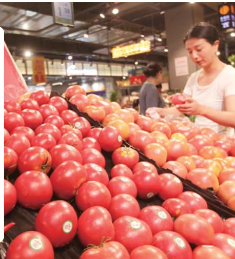
6月12日，消费者在山东省临沂市平邑县一家超市选购蔬菜。

国家统计局6月12日发布数据，5月份，全国居民消费价格指数(CPI)同比上涨0.3%，涨幅与上月相同，环比下降0.1%；全国工业生产者出厂价格指数(PPI)同比降幅比上月收窄1.1个百分点，环比上涨0.2%。国内物价持续平稳运行。