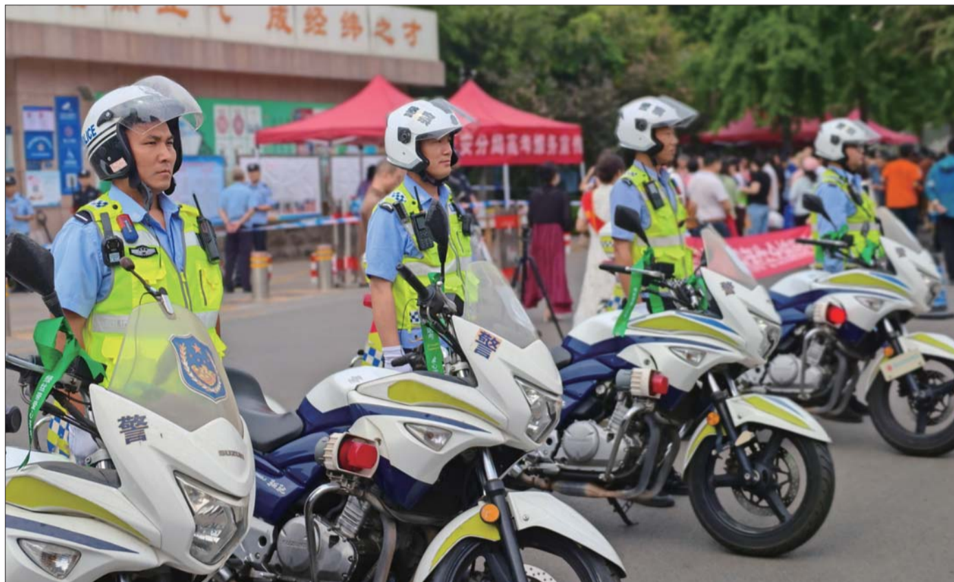
济宁多部门齐心协力，助力高考有序进行。

6月7日，济宁市6.5万名考生走进考场，向梦想出发，用笔下生花迎接生命中重要的一次大考。济宁多部门开启“护考模式”，全力以赴应对组织能力、保障能力等方面的大考，为考生营造安全、稳定、温馨的考试环境。