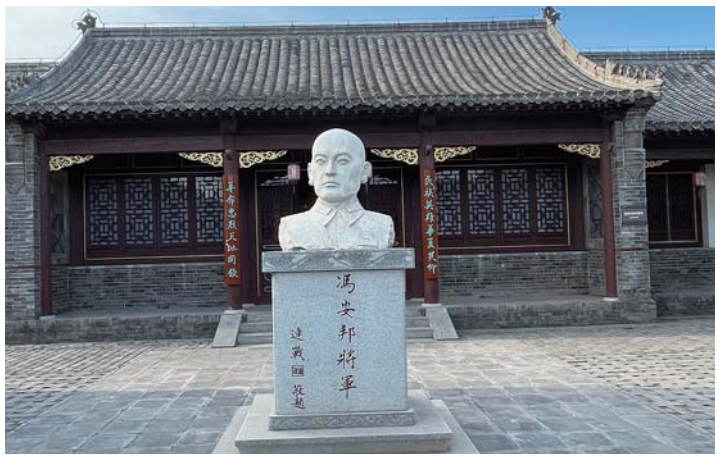
▲抗日英雄冯安邦塑像

7000平方。南院是王佐之旧宅，有着因珍藏北宋文学大家苏轼的“雪堂宝砚”而命名的“宝砚堂”，堪称整个吴氏祖居的精华之作。北院建于清康熙三年，单檐歇山式高台门楼，门楣上悬“尚书第”牌匾。