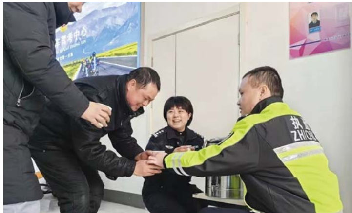
大队驾考中心坚持“暖流跑在寒流前”，为考生提供暖心贴心服务。