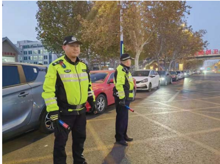
直属一大队助学岗警力在开展护学行动。