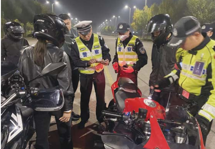
强化路面管控,减少各类风险隐患。