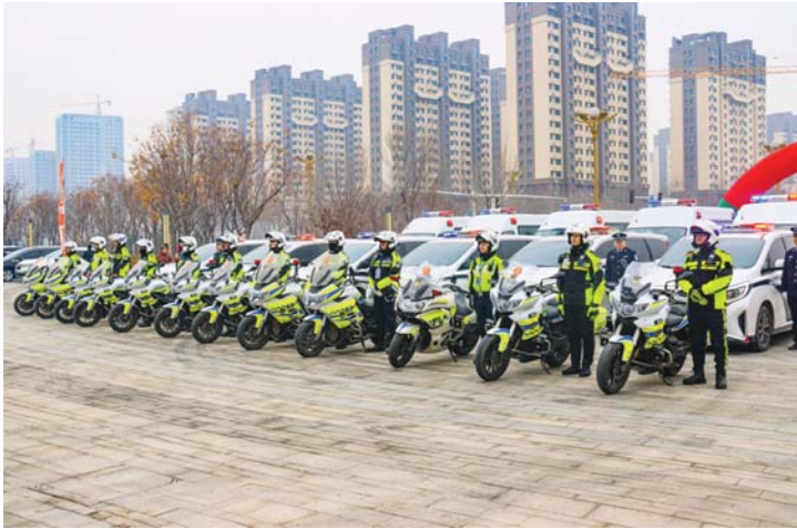
锤炼过硬队伍,提升交管工作现代化水平。