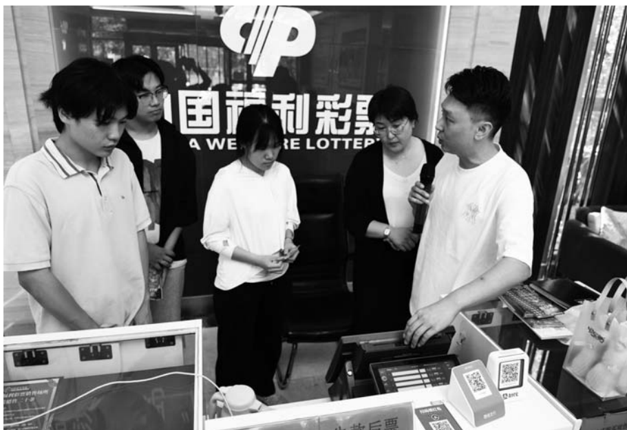
济南福彩工作人员对青年学生进行就业辅导。

在烟台的“青年创业实践基地”, 省福彩中心举办了“快乐公益 青春福彩”推介活动, 发布山东福彩青年创业扶持计划, 邀请创业导师分享经验并进行现场指导。在济南的“青年创业实践基地”, 培训师为应届毕业生详细讲解了福彩的基础知识, 销售场所设立的条件及流程, 日常销售、宣传、运营等情况。在临沂的“青年创业实践基地”, 市