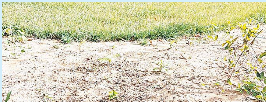
金科和雅东方小区内绿化已出现大面积裸露。

室，物业经理表示，信莱物业入驻该小区走的是正规招标流程。“今年5月，我们公司在中国招标投标公共服务平台，对金科和雅东方小区前期物业管理服务采购项目进行了投标并中标。”物业经理向记者出示了《招标公告和公示信息发布回执》印证了该说法，并表示，对于为何不选择业主集体投票的物业公司入驻，还需开发商解释，信莱物业也是依照规章制度入驻小区服务。