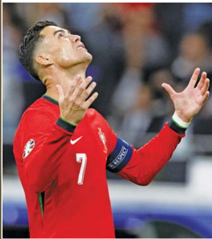
罚丢点球后的C罗非常痛苦。