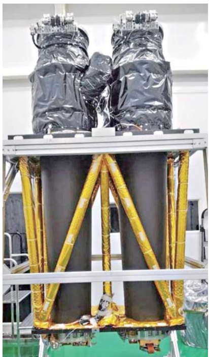
“风行天”空间X射线望远镜。据央视

为此，科学家通常使用X射线卫星，在大气层外进行观测，但是至今尚未成功拍摄到完整的X射线满月图像，月球就像被蒙上了一层神秘面纱。