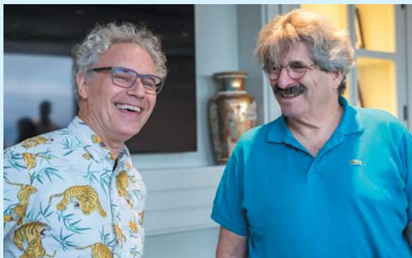
医学或生理学奖得主安布罗斯(左)和加里·鲁夫昆