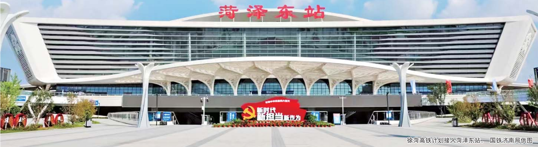
徐菏高铁计划接次菏泽东站。