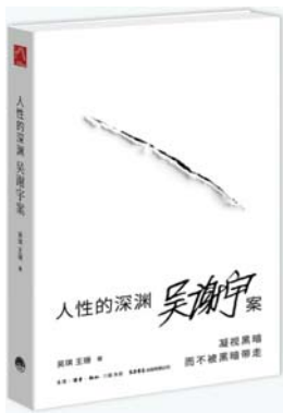
《人性的深渊:吴谢宇案》 吴琪 王珊 著 生活·读书·新知三联书店 生活书店出版有限公司

每月月底,本榜单从当月最新出版的文学艺术、历史传记、思想社科类图书中,参考图书网店的数据及专业书评媒体的评价,以人文性、思想性、趣味性为标准,筛选出一本重点推荐图书和九本好书,期待您的某一册能够进入您的内心。